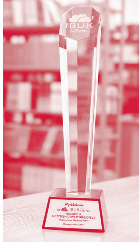
Wyróżnienie dla WBP w Krakowie za promocję e-czytelnictwa w Bibliotece.

Celem – zarówno warsztatów, jak i stoiska biblioteki w parku – było nie tylko zachęcenie do czytania, ale także kształtowanie właściwych postaw w sytuacjach społecznych, budowanie odpowiedzialności za zadania