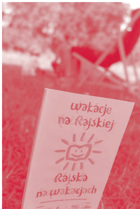
Wakacyjne warsztaty plenerowe w Parku im. Henryka Jordana w Krakowie

sezon jej działania. Lotna Czytelnia to projekt, który wystartował w sierpniu 2013 roku dzięki współpracy Wojewódzkiej Biblioteki Publicznej w Krakowie i Stowarzyszenia Kraków Miastem Rowerów. Od tego czasu systematycznie, co roku jest kontynuowany w okresie wiosenno-letnim. Charakterystyczny rower cargo krąży po Plantach od początku czerwca do końca września, zachęcając odpoczywających tam ludzi do czytania na świeżym powietrzu.