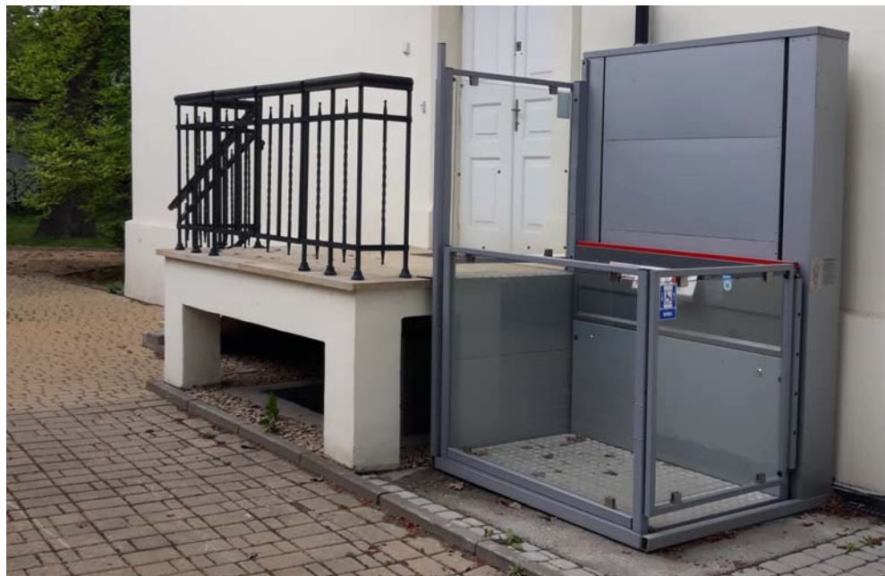
Winda dla niepełnosprawnych w Bibliotece Głównej Biblioteki Kraków

o prawach osób niepełnosprawnych z 2006 roku. Dotyczyć ma każdej dziedziny życia społecznego, również edukacji. Szczególnie jednak na tym ostatnim polu zmiany, przynajmniej w polskiej rzeczywistości, następują bardzo wolno [17] .