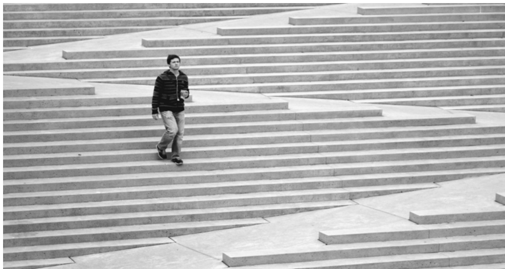
Schody według projektowania uniwersalnego, Robson Square, Vancouver

jako przesłanka etyczna w świadomości i aktywności ogółu odbiorców, uczestników różnego rodzaju przejawów i form świata kultury.